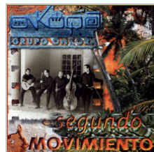
"Segundo Movimiento" Grabado en Caracas/Venezuela, Dic. 97