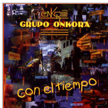
"Con el Tiempo" Grabado en Bremen/Alemania, Nov-Dic. 94