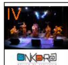
"Grupo Onkora IV" En grabación en Caracas/Venezuela, 2008-2009