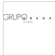
"Grupo Onkora 15 años" Grabado en Caracas/Venezuela, Ago. 00